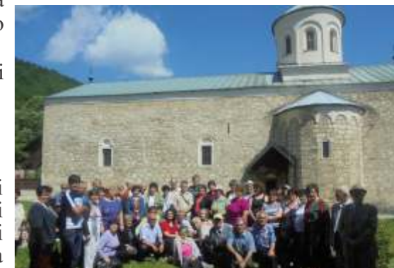
Posjeta manastiru Papraća