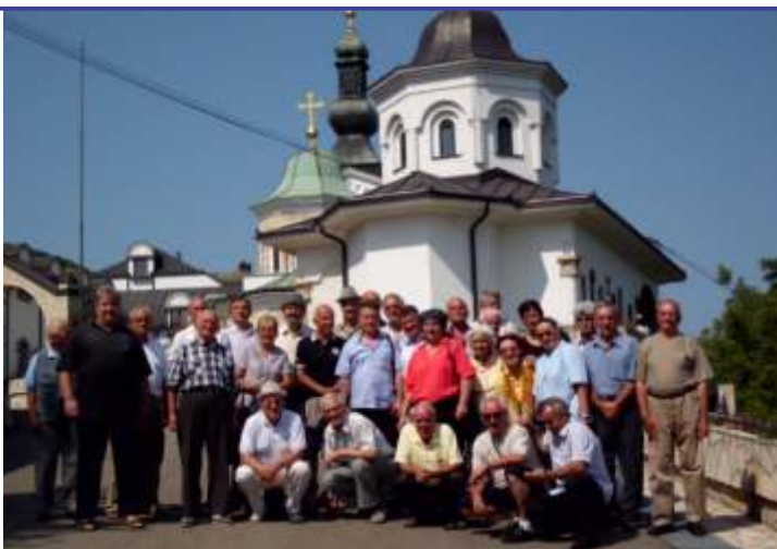
Penzioneri pred manastirom Tavna

Pozivamo sve nove penzionere koji stekli pravo na penziju, a koji se do sada nisu učlanili u Udruženje penzionera, da dođu u prostorije Udruženja radi učlanjivanja i evidentiranja a u cilju ostvarivanja određenih vidova pomoći kako bolesnim i nepokretnim tako i socijalno ugroženim članovima.