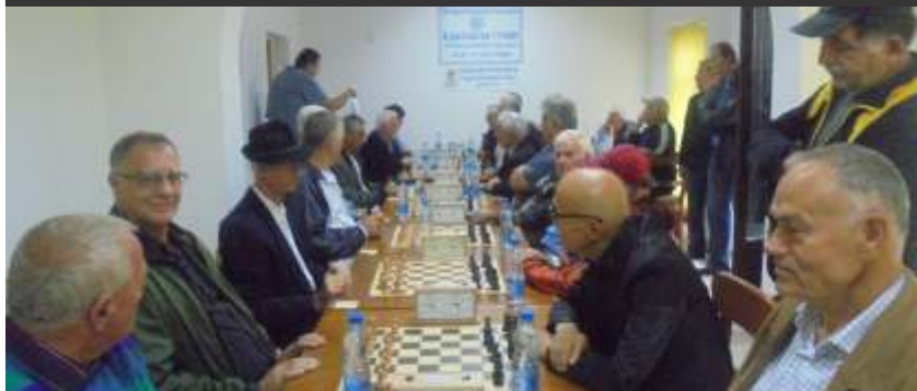
Učesnici šahovskog turnira

U prostorijama Kluba penzionera u Doboju održan je 3. šahovski turnir penzionera grada Doboja. Na turniru je učestvovalo 26 šahista penzionera a svečano otvaranje obavio je Obren Petrović, gradonačelnik Doboja koji je povukao prvi potez.