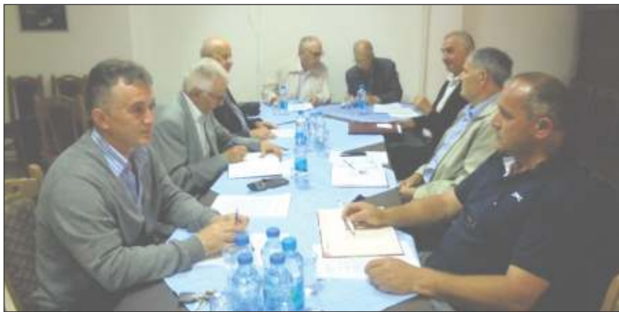
Sa Regionalnog sastanka u Doboju