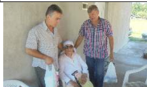
Posjeta penzionerki Kujundžić

Na kraju predavanja predsjednik kao i prisutni penzioneri izrazili su zahvalnost kako predavaču tako i JZU Bolnice „Sv. Apostol Luka“ na razumijevanju i omogućavanju predavanja specijaliste iz određenih oblasti koje su interesantne za najstariju populaciju.