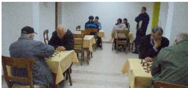
U Klubu penzionera