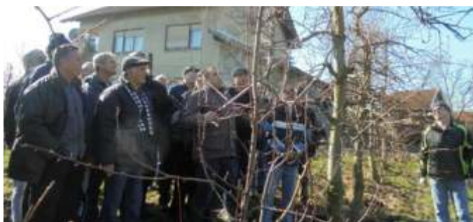
Kurs voćarstva - praktični dio

Pozivamo sve nove penzionere koji stekli pravo na penziju, a koji se do sada nisu učlanili u Udruženje penzionera, da dođu u prostorije Udruženja radi učlanjivanja i evidentiranja a u cilju ostvarivanja određenih vidova pomoći kako bolesnim i nepokretnim tako i socijalno ugroženim članovima.