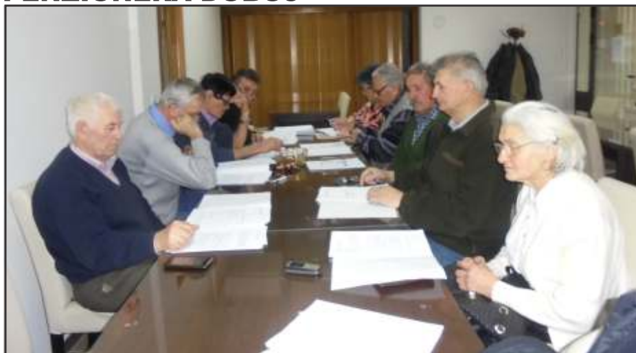
Sa sjednice Upravnog odbora