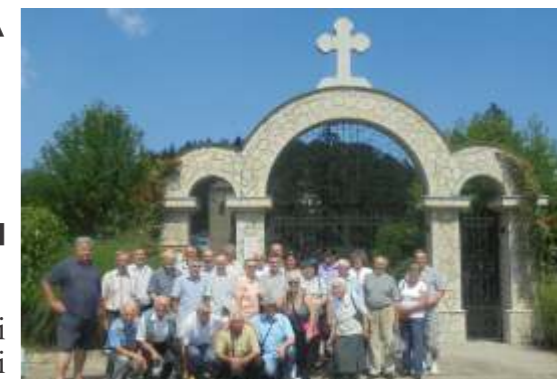
Penzioneri kod manastira na Ozrenu

U popodnevrim časovima penzioneri su posjetili i istorijsku Mrakovicu na Kozari gdje su obišli znamenitosti ovog centra.