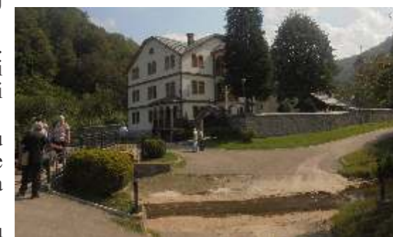
Kod manastira Moštanica