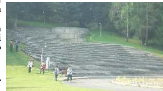
Nacionalni park Kozara