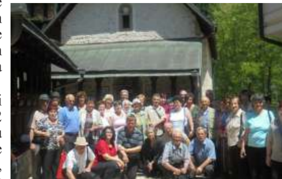
Penzioneri kod manastira Lovnica